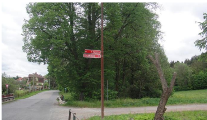
Stříbrná Skalice - místo srazu